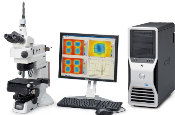
Abb. 2 Schnelle, hochgenaue 3D-Oberflächeninspektion mit dem BW-D501 von Nikon

Sowohl Oberflächenkonturen als auch die Rauigkeit unterschiedlichster Oberflächen können nun mit hoher Auflösung erfasst, dargestellt und analysiert werden ( Fehler! Verweisquelle konnte nicht gefunden werden. ).