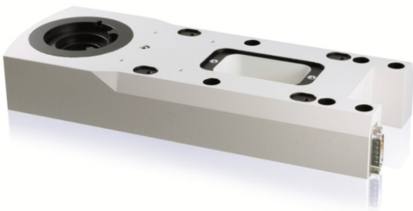
Abb. 3 Das piezobasierte Nanopositioniersystem bewegt den kompletten Revolver mit den unterschiedlichen Objektiven in Richtung der z-Achse

Dazu wurde ein Positioniersystem direkt im Mikroskop integriert, das den kompletten Revolver bewegt (Abb. 3). Dadurch lassen sich die unterschiedlichen Objektive nacheinander in Richtung der Z-Achse hochpräzise verfahren.