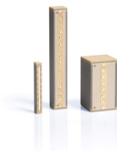
Abb. 4 Die Piezoaktoren arbeiten verschleiß- und reibungsfrei sowie ohne Spiel

Für diese Wahl sprachen gleich mehrere Gründe: Piezoaktoren (Abb. 4) arbeiten verschleiß- und reibungsfrei sowie ohne Spiel.